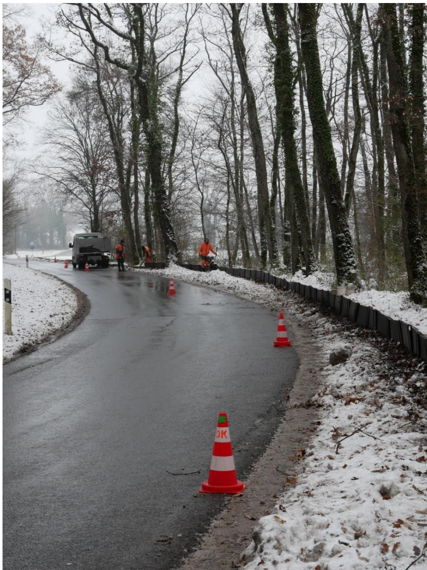
montage des barrières pour la protection des amphibiens à Jussy

Depuis sa création, l'association a donné la possibilité à environ 250 personnes de travailler à des durées variables.