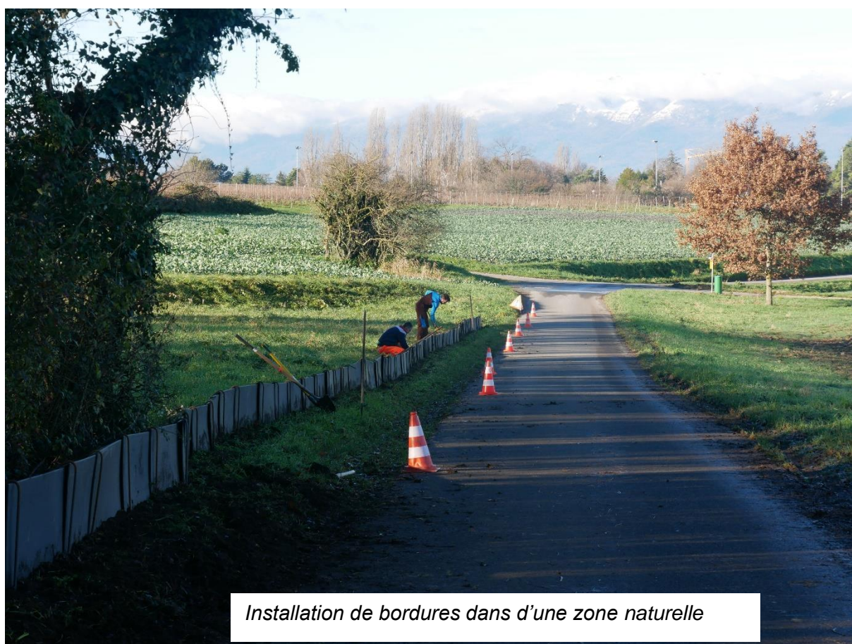
Installation de bordures dans d'une zone naturelle

En 2024, notre objectif premier sera d'assurer la pérennité de l'Association.